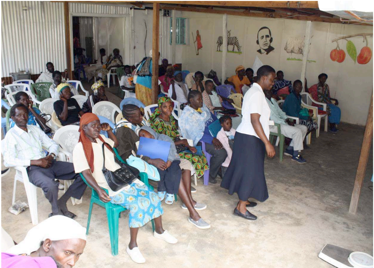
Er is een grote polikliniek voor Aids patiënten die er hun medicijnen kunnen komen halen en behandeld kunnen worden.