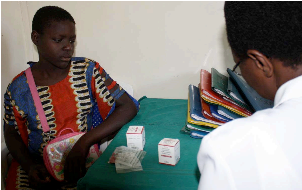
Medicijnverstrekking aan HIV+ mensen.